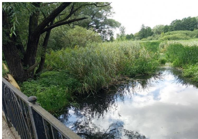
Рисунок 3 – Вид русла р. Товарной ниже ул. Суворова

Р. Товарная берет начало 1,3 км северо-восточнее поселка Поддубное Багратионовского района, протекает по территории Гурьевского муниципального округа и территории города Калининграда, впадает в небольшую гавань судоремонтного предприятия на берегу р. Преголя в 4,8 км от устья. Р. Товарная до ж/д Калининград-Москва течет в северном направлении, далее в северо-западном и западном направлениях. В границах городской черты р. Товарная течет от ул. Цветочной до впадения в р. Преголю.