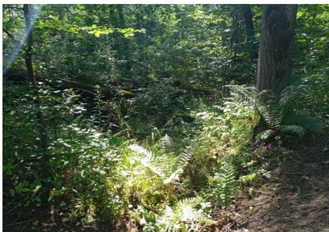
Рисунок 2 – Вид русла р. Товарной в истоке

Рекогносцировочное обследование р. Товарной выполнено методом маршрутного обследования с целью определения коэффициента шероховатости, возможности затопления участка, с фотофиксацией.