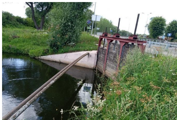
Рисунок 1 – Шлюз-регулятор на р. Товарной на ПК3+24

В верховьях русло слабоизвилистое, шириной около 7 м, часто безводное и сильно заросшее. В среднем течении ширина достигает 10–15 м, глубина – 0,4–1,2 м. Наблюдаются участки с признаками загрязнения (следы мазута), заросли камыша, поваленные деревья. В нижнем те-