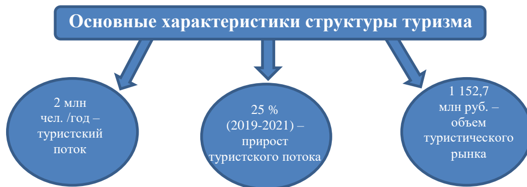
Рисунок 1 – Основные характеристики структуры туризма в Калининградской области [2]

ценами в аналогичные месяцы прошлого года. Снижение годового ценового индекса в этих категориях гостиниц происходило до конца весны и продолжилось летом, что представлено в таблице 1 [2].