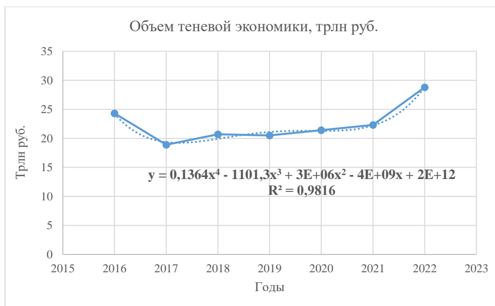
Рисунок 1 – Линия регрессии объема теневой экономики России в 2016–2022 гг.

На основании анализа выявлены основные проблемы в деятельности ФТС: