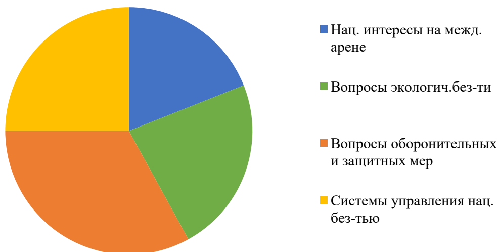
Рисунок 2 – Результат структурного анализа Стратегии национальной безопасности 2014 г.