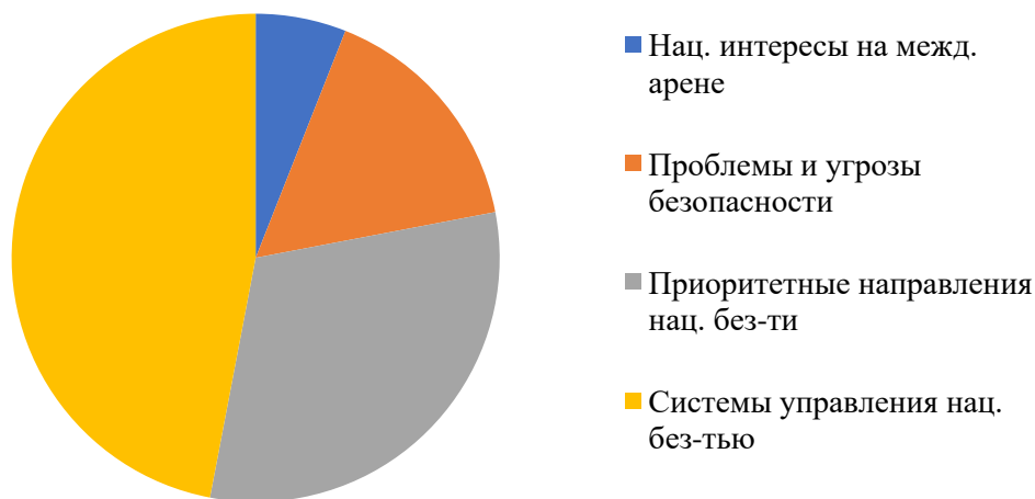
Рисунок 1 – Результат структурного анализа Стратегии национальной безопасности 2007 г.

Для наиболее удобного восприятия результаты структурного анализа стратегий 2007 [12], 2014 [22] и 2020 гг. [24] представлены соответственно на рисунках 1–3.