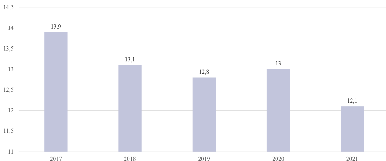
Рисунок 2 – Динамика показателя доли в ВВП России экономических операций, ненаблюдаемых статистическими методами, 2017–2021 гг., в % к ВВП

На рисунке 2 [7] представлена динамика удельного веса ненаблюдаемых операций в объеме произведенного ВВП с 2017 по 2021 г.