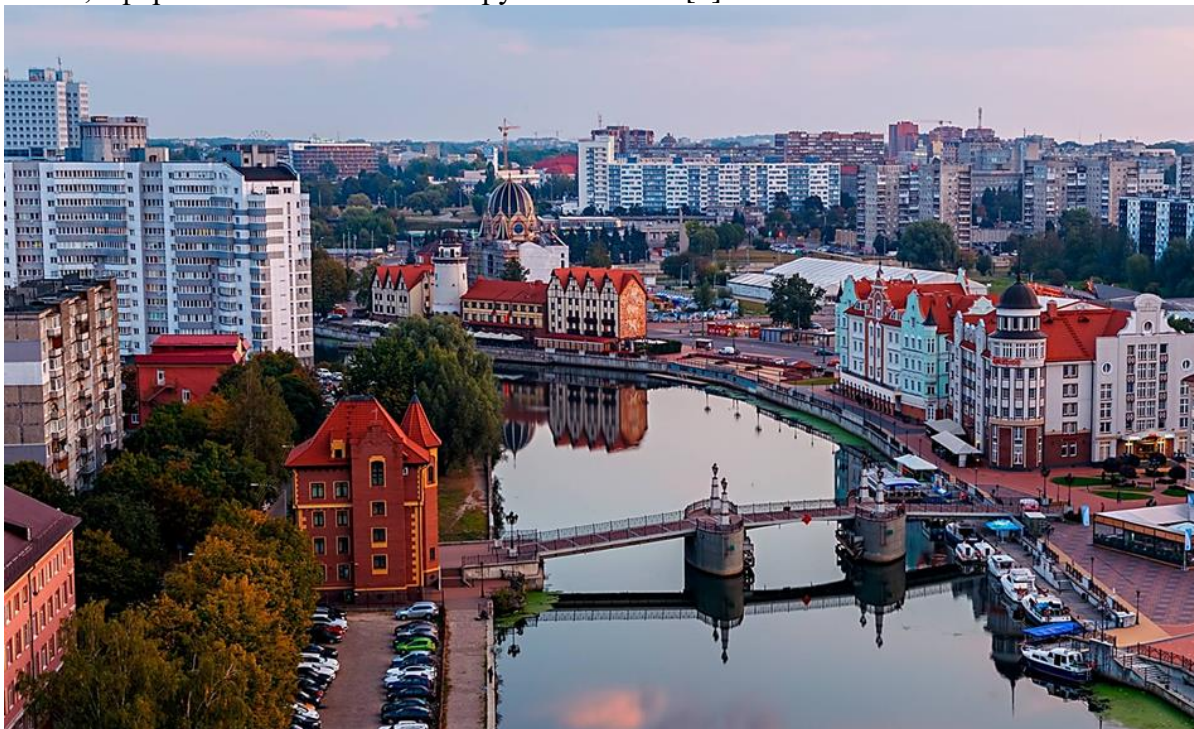
Рисунок 1 – Архитектурный облик Калининграда

Калининград красив, но выборочно (рис. 1). Центр города с его панельными зданиями никого не удивит и не впечатлит, но старые улицы подарят новые впечатления. Находясь на пересечении культур и впитав в себя архитектурные традиции двух разных стран, город до сих пор не может определить дизайнерский вектор своего развития. Именно поэтому на фоне многоэтажных зданий красуются современные проекты, по типу комплекса зданий "Рыбной деревни", оформленного в восточно-прусском стиле [5].