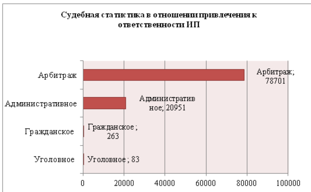
Рисунок 1 – Диаграмма судебной статистики в отношении привлечения к ответственности ИП

Как видно из приведенных в табл. 1 статистических данных, за десять лет (2008-2018 гг.) судами различных инстанций было рассмотрено 99998 дел, связанных с осуществлением предпринимательской деятельности (рис. 1). Представленная судебная статистика взята нами на основе анализа правоприменительной практики из открытых источников в сети Интернет [3].