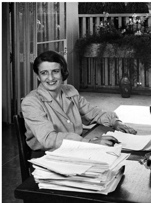
Рисунок 1 – Фотография Айн Рэнд

В условиях развития современного общества зачастую появляются новые философские течения. Некоторые из них являются адаптированными для нашего времени ответвлениями от трудов классических философов, другие же представляют собой синтез знаний, переосмысленных в новую философскую теорию. Примером такого переосмысления является философия объективизма, созданная писательницей и философом Айн Рэнд (рис. 1). По ее мнению, объективизм – это философия для жизни на Земле. Объективизм – целостная философская система, которая охватывает и увязывает воедино этику, эстетику, онтологию, гносеологию и политику. Созданная в середине XX в., данная философия является единственным масштабным трудом подобного уровня за всю историю прошлого столетия [1].