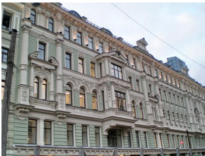
Рисунок 2 – Здание в Санкт-Петербурге, ул. Восстания, д. 2

Для понимания причин появления объективизма необходимо проследить весь жизненный путь Айн Рэнд. Она родилась в Санкт-Петербурге 20 января 1905 г. в семье медицинских работников. Айн Рэнд – псевдоним, который урожденная Алиса Зиновьевна Розенбаум взяла в дальнейшем. В семье Розенбаум было три дочери, среди которых Алиса была старшей. Отец Айн Рэнд работал фармацевтом в аптеке, находившейся в центре города, и семья проживала в квартире над ней (рис. 2) [4].