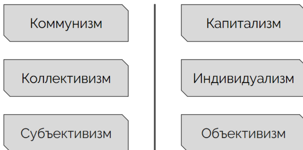
Рисунок 4 – Позиции объективизма по отношению к Советской идеологии

Как философ Айн Рэнд исследовала вопрос взаимосвязи морали и политики, пользуясь своим жизненным опытом из абсолютно разных социумов, таким образом, еще в середине XX в. она актуализировала весьма важные вопросы для современной России. В первую очередь для преодоления имеющихся политических, экономических, социальных и культурных проблем должны запуститься механизмы изменения менталитета общественного и индивидуального сознания. Только после таких изменений страна обретет граждан с высокой политической, экономической и правовой культурой, которые осознают собственную ценность и достоинство. Индивидуализм, пропагандируемый в философии Айн Рэнд, является очень важным аспектом в контексте постепенного изменения менталитета современного российского общества [6].