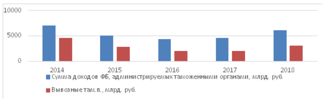
Рисунок 1 – Динамика доходов РФ от вывозных таможенных пошлин

пошлин в отношении важных товаров, вывозимых с территории России, как на постоянной, так и на временной основе.