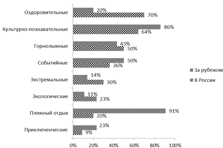
Рисунок 1 – Потенциал развития отдельных видов туризма, по мнению UNWTO и ФАТ [1]